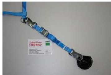
Adaptergurt mit 2 Karabinern und Klemmschloss

Das Netz ist geprüft und somit zugelassen für 900daN