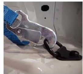
Original Zurröse mit Adaptergurt