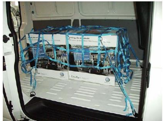
Ladegutsicherungsnetz mit viel Ladung

Wir lassen dieses Ladegutsicherungsnetz für Sie in der jeweiligen Anforderung nähen Sie wählen die Gurtbandfarbe / Maschenweite / Gesamtgröße / Anschlagmittel am Gurt